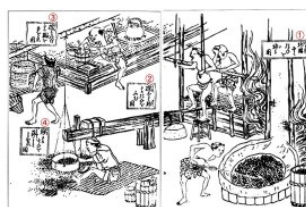
アサキ屋の米穀処理。① 米穀を篩ふる。② 臼で、砕いた米穀を篩を替へて篩ふる。③ 砕いた米穀を篩を替へて篩ふる。④ 篩ふる米を臼で搥る。⑤ 搥った米を篩を替へて篩ふる。⑥ 篩ふる米を臼で搥る。⑦ 搥った米を篩を替へて篩ふる。⑧ 篩ふる米を臼で搥る。⑨ 搥った米を篩を替へて篩ふる。⑩ 篩ふる米を臼で搥る。⑪ 搥った米を篩を替へて篩ふる。⑫ 篩ふる米を臼で搥る。⑬ 搥った米を篩を替へて篩ふる。⑭ 篩ふる米を臼で搥る。⑮ 搥った米を篩を替へて篩ふる。⑯ 篩ふる米を臼で搥る。⑰ 搥った米を篩を替へて篩ふる。⑱ 篩ふる米を臼で搥る。⑲ 搥った米を篩を替へて篩ふる。⑳ 篩ふる米を臼で搥る。㉑ 搥った米を篩を替へて篩ふる。㉒ 篩ふる米を臼で搥る。㉓ 搥った米を篩を替へて篩ふる。㉔ 篩ふる米を臼で搥る。㉕ 搥った米を篩を替へて篩ふる。㉖ 篩ふる米を臼で搥る。㉗ 搥った米を篩を替へて篩ふる。㉘ 篩ふる米を臼で搥る。㉙ 搥った米を篩を替へて篩ふる。㉚ 篩ふる米を臼で搥る。㉛ 搥った米を篩を替へて篩ふる。㉜ 篩ふる米を臼で搥る。㉝ 搥った米を篩を替へて篩ふる。㉞ 篩ふる米を臼で搥る。㉟ 搥った米を篩を替へて篩ふる。㊱ 篩ふる米を臼で搥る。㊲ 搥った米を篩を替へて篩ふる。㊳ 篩ふる米を臼で搥る。㊴ 搥った米を篩を替へて篩ふる。㊵ 篩ふる米を臼で搥る。㊶ 搥った米を篩を替へて篩ふる。㊷ 篩ふる米を臼で搥る。㊸ 搥った米を篩を替へて篩ふる。㊹ 篩ふる米を臼で搥る。㊺ 搥った米を篩を替へて篩ふる。㊻ 篩ふる米を臼で搥る。㊼ 搥った米を篩を替へて篩ふる。㊽ 篩ふる米を臼で搥る。㊾ 搥った米を篩を替へて篩ふる。㊿ 篩ふる米を臼で搥る。㊿ 搥った米を篩を替へて篩ふる。