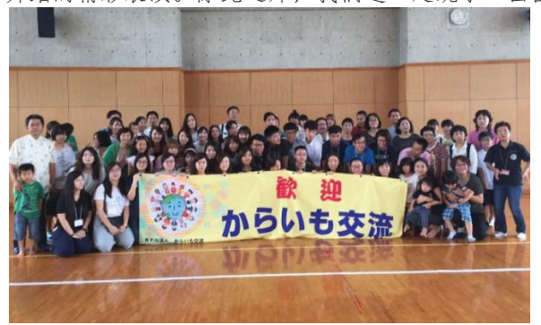
圖 1: 與寄宿家庭會面後全體大合照

隨着參加者陸續抵達,我們認識了許多來自台灣的學生,並在交談和「聽粵語猜國語」的遊戲中,迎來了親睦會的開始。所說的親睦會,其實是集合所有參加者,並以抽籤分配座位的方式,讓來自各地的學生與當地人可透過一同享用晚餐互相交流。會上,學生一位位上台自我介紹,而當地人亦為我們帶來了竹笛與傳統舞蹈的精彩表演。除此之外,我們還一起跳了一曲因日劇《逃跑雖可恥但是有用》風靡全球的「戀 Dance」。