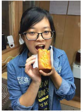
圖 4: 在咖啡店幫忙制作甜品成果

我的家庭所居住的志市志市一共有三個家庭參與了今年度的夏季からいも交流計劃。十分湊巧,三個家庭接待的學生均來自香港中文大學。在初到志布志市的第一天,同市的三個家庭在其中一名參與交流計劃的家庭成員—開語言教室的西岡先生店裏集合,並舉辦了「歡迎からいも交流學生來到志市志市大會」。