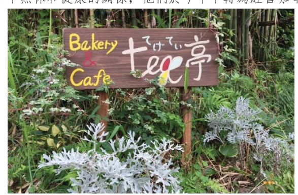
圖 3: Tege 亭咖啡店招牌

接待我的今村家庭是經營咖啡廳的。據今村先生說,往年他們是以種士多啤梨作為主要收入來源,但由於年中無休和健康的關係,他們於今年中轉為經營咖啡廳。