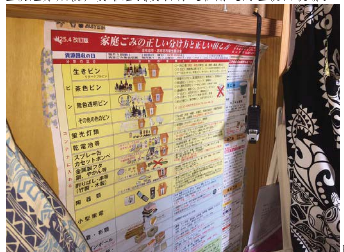
圖 9: 志布志市垃圾分類指南

說到志布志市,不得不提這市的垃圾處理制度。我甚至認為這個市可以成為「回收」二字的代名詞。 志布志市的回收制度十分仔細。與大部分日本城市只以可燃和不可燃分類垃圾不同,該市的垃圾類別有近三十 種。就是瓶子,也能分作回樽、茶色瓶、透明瓶和其他顏色四類,更別說還有紙張、紙皮箱、鋁和衣物等普通 的分類。而垃圾經分類後,要靠居民要自行送往附近的垃圾回收場。